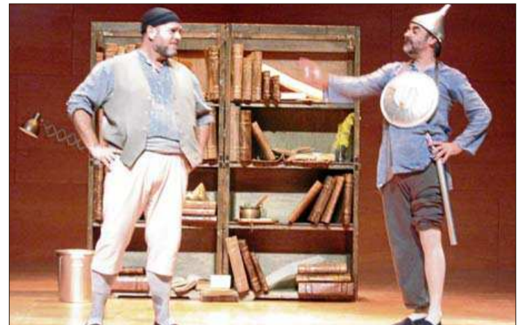
'Un Quixot de cine', una de les activitats proposades.