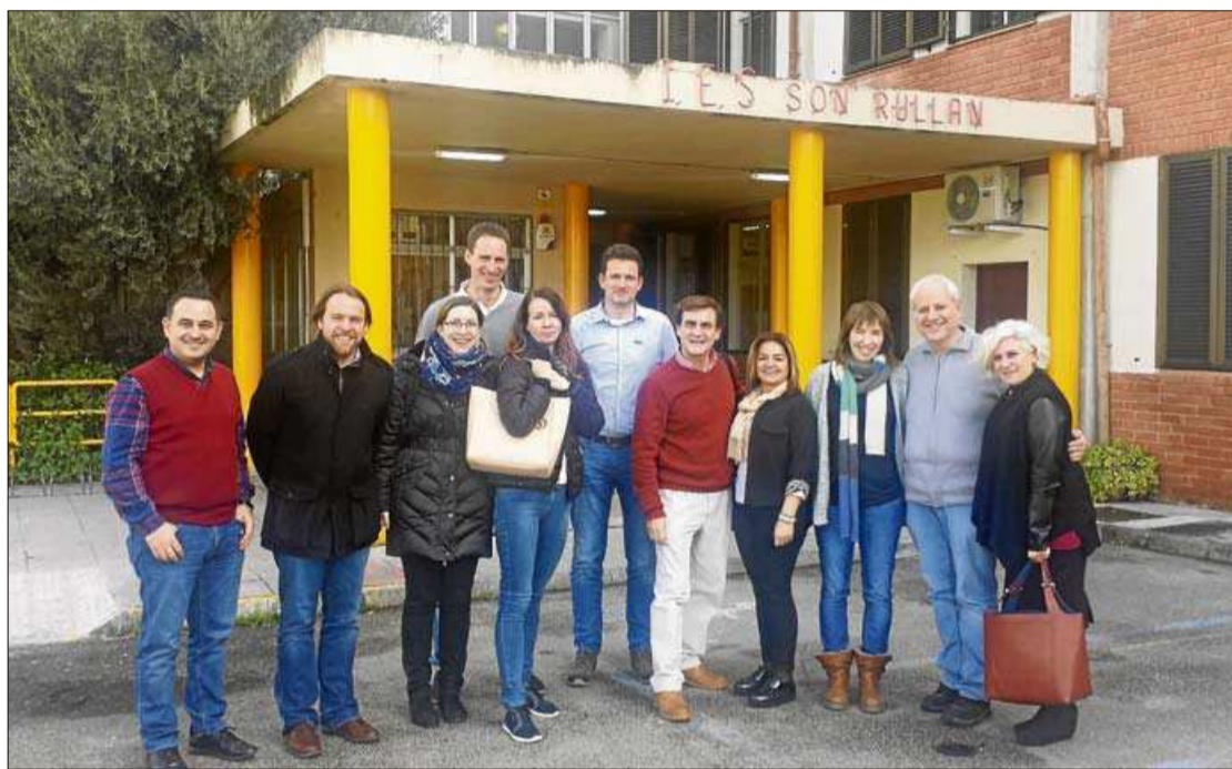
Aquest projecte Erasmus de l'IES Son Rullan finalitzarà l'any 2019. IES SON RULLAN

► Professors d'Àustria, Alemanya, Finlàndia i Turquia visitaren fa poques setmanes aquest institut de Palma per preparar un projecte conjunt